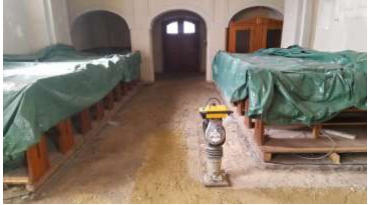
Freiwillige Helfer bei der Arbeit.....